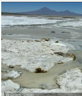
Salar en la Región de Atacama (0 - 7 m.a.)

Grandes partes de la Región Atacama muestran un cubierto de rocas clásticas - generalmente de tipo aluvial . Las precipitaciones torrenciales esporádicas provocan un transporte corto del tipo aluvión . Frecuentemente los grandes