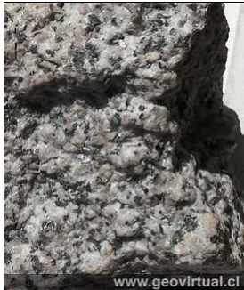
Diorita del Batolito Andino en Atacama