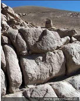
Intrusivo pérmico de la Región de Atacama, Chile: Véase Granitos del pérmico