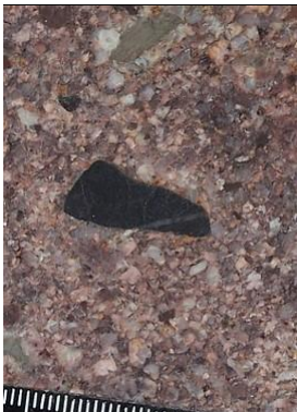
Formación La Ternera - Triásico en Atacama - Chile. -Paraconglomerado. Formación La Ternera