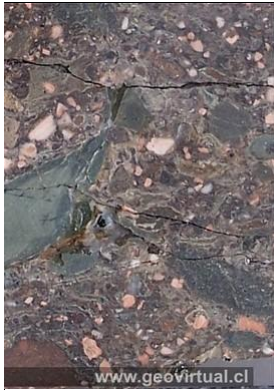
Roca piroclástica del mesozoico en la Región de Atacama