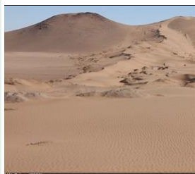
Dunas en la Región de Atacama, Chile

llanuras con presencia de las gravas de Atacama (mioceno) tienen una cubierta de secuencias cuaternarios (por ejemplo lano de Varas cerca de Inca de Oro ).