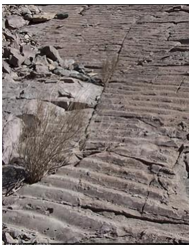
Formación de Pabellón - cretácico de la Región de Atacama - Chile Véase: Formación Pabellón

Contenido: Las secuencias más importantes