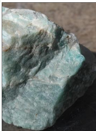
Microclina - Amazonita