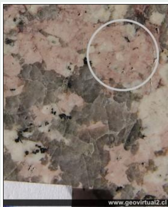
Feldespato Alcalino en granito

La serie de plagioclasas no está afectada gravemente por un descenso en la temperatura. Los cristales mixtos de la serie de plagioclasas se forman a temperaturas elevadas y bajas.