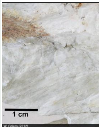
Albita Foto Albita

En magmatitas ácidas a intermedias como granitos, riolitas, dioritas. En pegmatitas como cristales gruesos. En rocas magmáticas y sus pegmatitas. En rocas metamórficas de grado bajo. En areniscas la albita puede formarse después de la sedimentación (formación autógena).