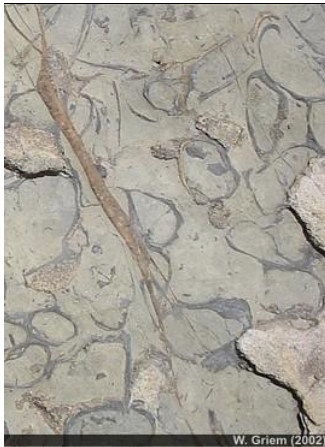
Caliza: Roca sedimentaria organogénea. Museo Virtual: Caliza