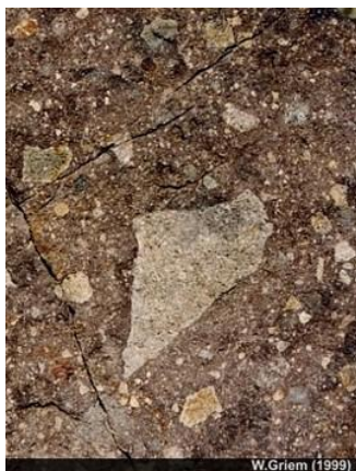
Arena: Roca sedimentaria clástica. Museo Virtual: Arena