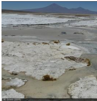
↑ Salar de Pedernales en la Región de Atacama - Chile.

Mirador Virtual: El Salar de Pedernales con Co. Doña Inés