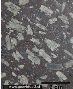
Textura porfídica de una Andesita (roca volcánica). véase en grande

Página: Intro. / Lava / Volátiles / Gradiente Geotérmico / Fundición / Tipos / Origen