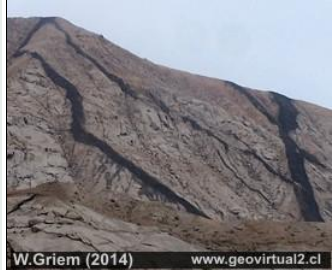
↑ Diques en el Norte de Chile, cerca de Chañaral Véase Museo Virtual