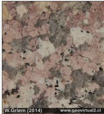
↑ Granito Véase Museo Virtual