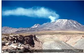
↑ Actividad del volcán Lascar en el Norte de Chile. Véase Museo Virtual