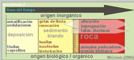
Figura: Línea del tiempo y origen de estructuras entre la deposición hasta la roca dura.

Los seres vivos dejaron o dejan sus huellas en el sedimento. Una forma es la bioturbación que se refiere a una estructura irregular, que corta o perturba la estratificación y que se debe a la acción de organismos excavadores. (Foto: Bioturbación, labores). Lo otro serían las trazas de organismos conservadas en el sedimento, por ejemplo trazas de trilobites en un sedimento arcilloso cubierto por un sedimento de silt.