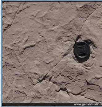
Bioturbación en rocas cretácicas - Región de Atacama. (Foto W. Griem)

c) Gotas de lluvia: Rara vez - especialmente en sectores áridos se mantienen las estructuras de impacto de las gotas de la lluvia. (Foto)