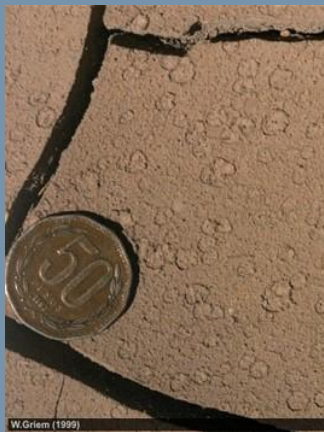
Impactos de Gotas de Lluvias en el desierto de Atacama.

Páginas de Geología Apuntes Geología General Apuntes Geología Estructural Apuntes Depósitos Minerales Colección de Minerales Periodos y épocas Figuras históricas