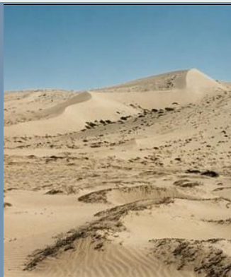
Dunas en el desierto de Atacama, Chile

Depósito eólico de tamaño silt con una cierta cantidad de carbonatos. Puede ser poroso.