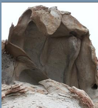
Tafoni en Atacama Aquí

Página: Ambiente eólico - viento - Dunas