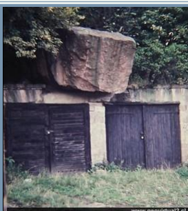
Rock fall - caída de bloque: Ejemplo de Alemania. véase en grande