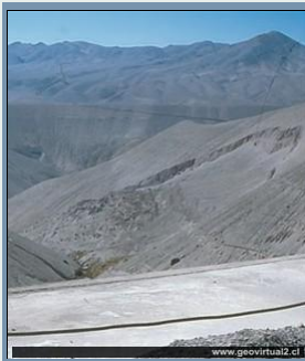
Deslizamiento en el desierto de Atacama. En grande