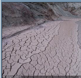
Mud flow en el desierto de Atacama Véase en grande