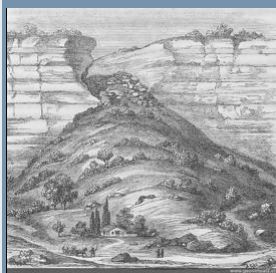
Cono aluvial - de Rossmässler en 1863 Véase en el módulo de retratos históricos

transportan una cantidad de sedimentos de aprox. 10 km 3 hacia al mar. Es decir cada segundo mundialmente llegan 317.000 m 3 sedimentos de la tierra firme hacia al mar, sería equivalente que cada minuto 176.000 camiones grandes descargan su carga al mar.