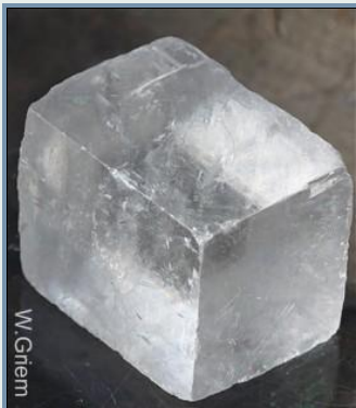
Ejemplo de un mineral transparente: Calcita de Islandia o Calcita transparente.

Minerales idiocromáticos con colores distintos son por ejemplo: