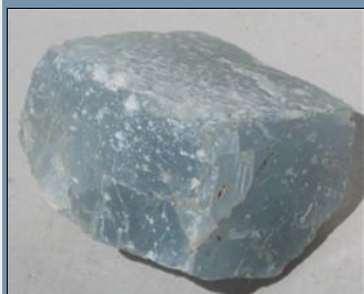
Típica "maldad" de la naturaleza: Calcita de color azul. véase en la colección virtual