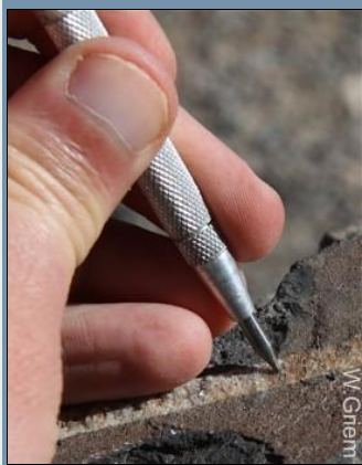
Uso del rayador - ojo muchos rayadores tienen una dureza sobre MOHS 7.