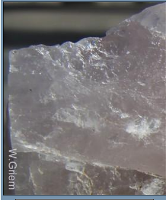
Exfoliación ausente en cuarzo - concoide

Macla de interpenetración se refiere a los cristales unidos por un plano de composición - superficie a lo largo de la cual los dos individuos están unidos - irregular, por ejemplo. ortoclasa.