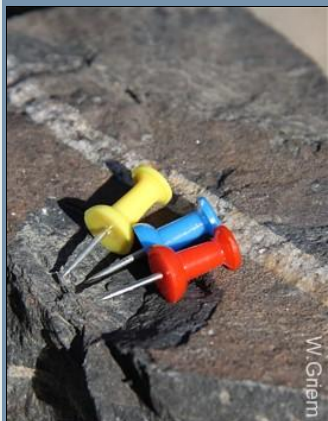
Una herramienta no muy costosa: Los chinchos ficheros tienen justamente la dureza de MOHS 5 - es decir sirven bastante como "original - rayador".