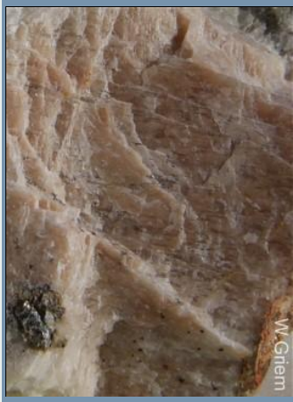
Exfoliación buena en dos direcciones de un feldespato

Cabe mencionar que modificaciones del mismo mineral pueden ser transparente o semitransparente.