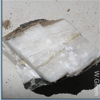
Exfoliación buena en tres direcciones: Calcita