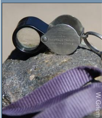
Lupa de bolso para observar minerales y rocas.