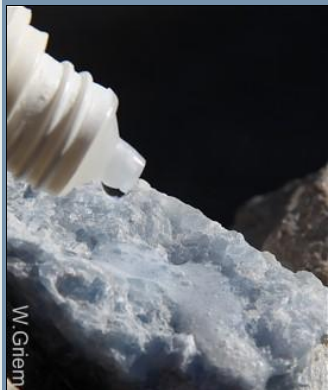
Reacción de ácido clorhídrico con carbonato de calcio - se ve y se escucha la reacción.

\text{CaCO}_3 + 2\text{HCl} \rightarrow \text{H}_2\text{CO}_3 (dióxido de carbono diluido en agua) + \text{CaCl}_2 y \text{H}_2\text{CO}_3 se descompone en \text{H}_2\text{O} y dióxido de carbono \text{CO}_2 (gas).