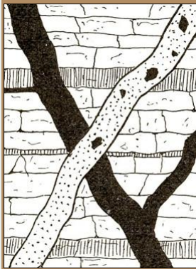
Intersección de diques (Walther 1908) aquí en total

Página: Introducción • Tipos de Lineaciones